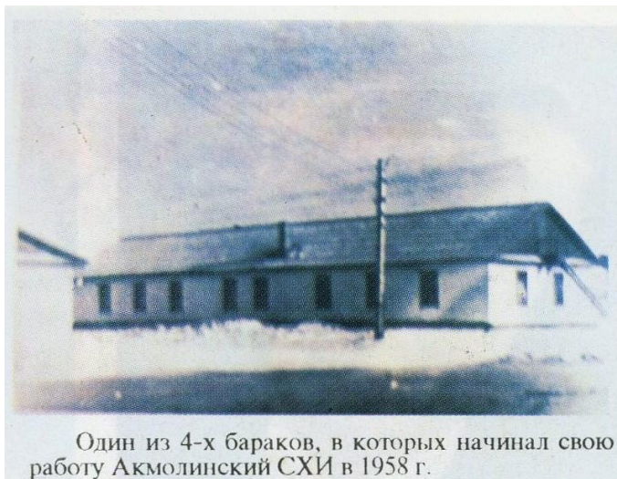
Один из 4-х бараків, в которых начинал свою работу Акмолинский СХИ в 1958 г.

КСРО Министрлер Кеңесінің 3.10.1957 ж. №1176 Қаулысына сәйкес Ақмола ауылшаруашылық институты құрылған ҚазАТУ-дағы тұңғыш факультеттер университет тарихына алтын әріппен еніп отыр. Олардың қатарында 1957 жылдан бері жұмыс істейтін агрономия факультеті бар.