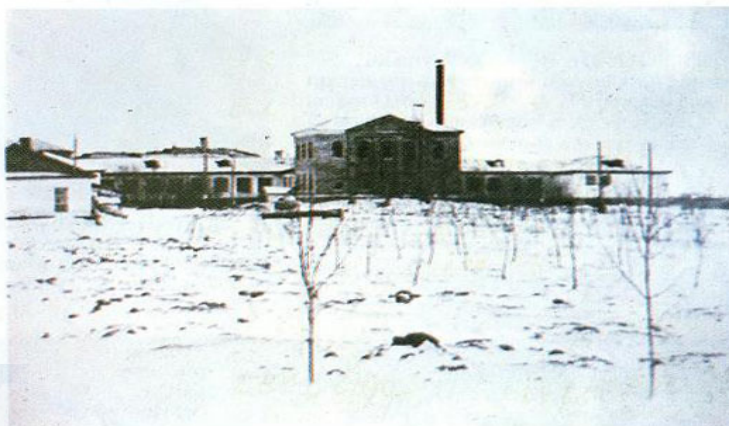
Здание железнодорожного училища № 4, на базе которого начал строиться Акмолинский СХИ в 1958 г. (ныне корпус агрономического факультета).